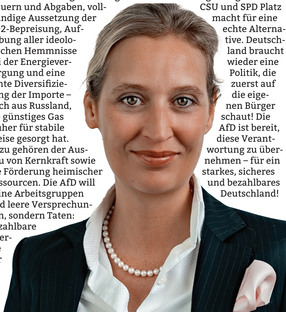
Alice Weidel (47) ist Co-Vorsitzende der AfD-Bundestagsfraktion und auch Bundessprecherin der Alternative für Deutschland.

macht für eine echte Alternative. Deutschland braucht wieder eine Politik, die zuerst auf die eigenen Bürger schaut! Die AfD ist bereit, diese Verantwortung zu übernehmen – für ein starkes, sicheres und bezahlbares Deutschland!